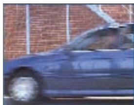
Черезстрочная развертка, разница между четными и нечетными линиями 20 мс