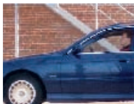
Построчная развертка, все линии отображаются одновременно

Прогрессивное сканирование используется вместо метода черезстрочной развертки, применяемого в аналоговых CCTV (PAL/NTSC) камерах. При его использовании все точки (линии) отображаются одновременно, что позволяет передавать изображение движущихся объектов без искажений.